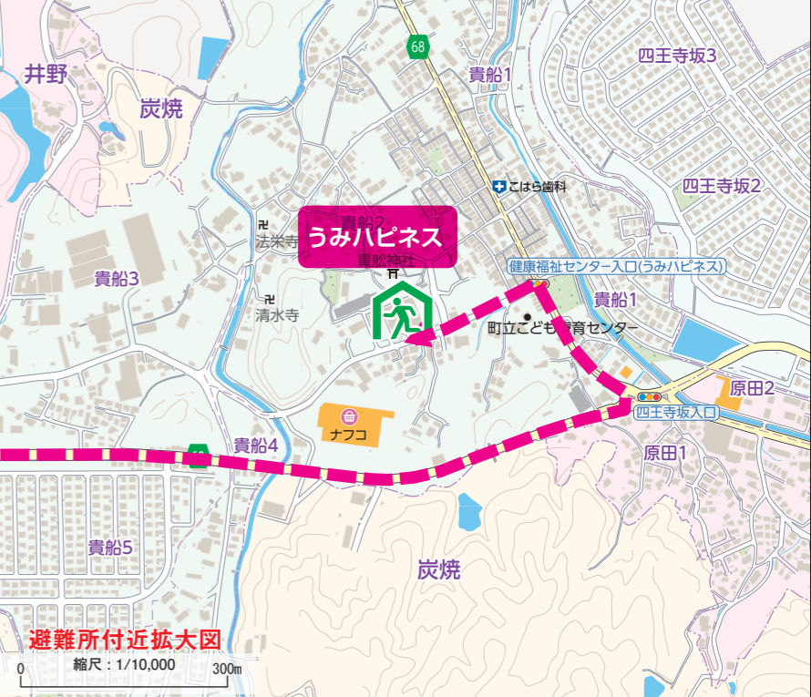
避難所付近拡大図 縮尺：1/10,000